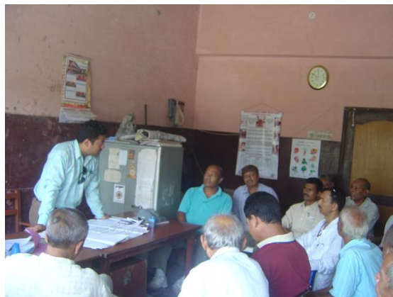
मिति २०६७/०४/२३ देखि २०६७/०४/३० गते सम्म भएको वडा भेला कार्यक्रम