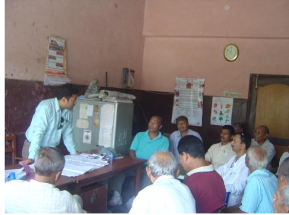
मिति २०६७/०४/२३ देखि २०६७/०४/३० गते सम्म भएको वडा भेला कार्यक्रम