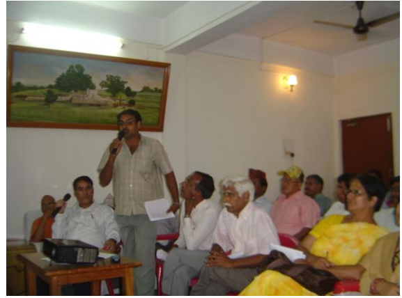
— सिद्धार्थनगर नगरपालिकाको ५ वर्षे दीर्घकालीन सोच निर्धारण कार्यशाला गोष्ठी —